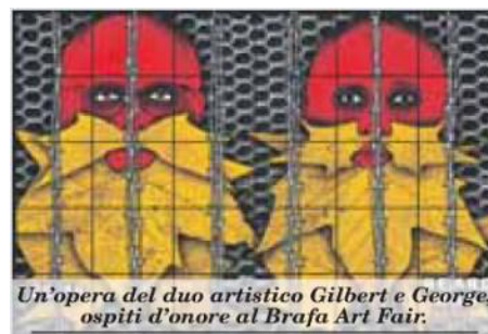
Un'opera del duo artistico Gilbert e George, ospiti d'onore al Brafa Art Fair.