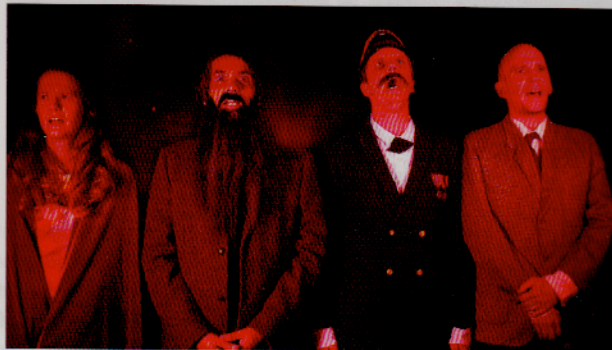
Tony Oursler, Le volcarn, 2015 - 2016, video installazione 3D DLP.