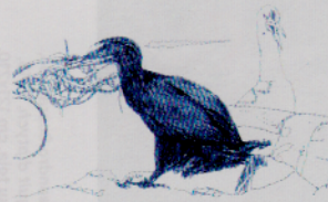
Marangone dal ciuffo

Collaborazione con il Museo di Arte Moderna di Venezia