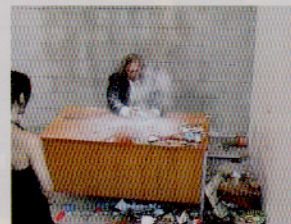
Jimmie Durham, Smashing , 2004, fotogrammi da video, colore, suono, 92'

Oltre agli eventi di ART CITY, segnate venerdì 24, ore 14.30: per due ore circa, l'ottantenne Jimmie Durham ( Leone d'Oro alla carriera alla Biennale di Venezia), si produrrà in una memorabile performance nel Padiglione 15. Quanto agli altri titoli del programma di eventi dal vivo in Fiera, non temete di perderli: si ripeteranno ciclicamente da venerdì a domenica.