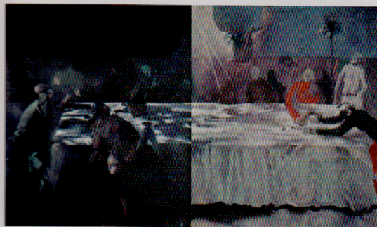
Alessandro Scarabello, Banquet diptych , 2018, olio su tela, cm 121x210.