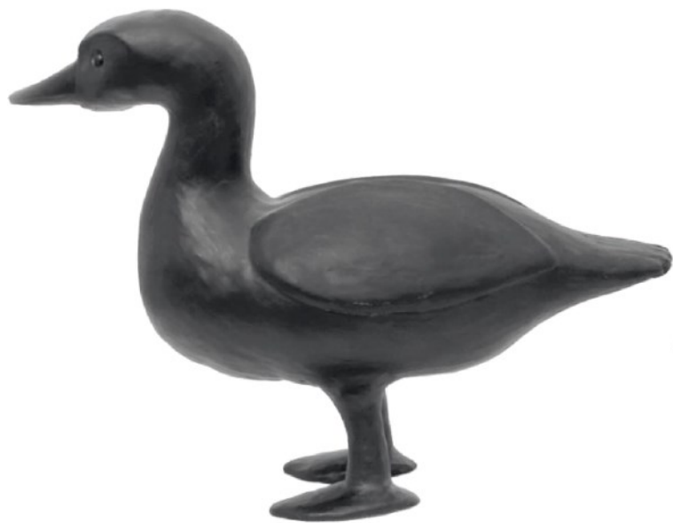
Wolfram Ullrich. AFON , (2019) proposto a Dep Art Gallery