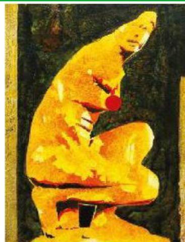
Nicola Villa - COME DI PIETRA FERITA - tecnica mista su tela 2017