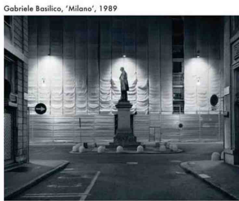
Gabriele Basilico, 'Milano', 1989

from the 'Las Vegas Studio', project curated by Hilmar Stadler and Martino Sisti