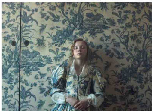
Fiona Tan, 'Nellie', videoinstallazione, 2013