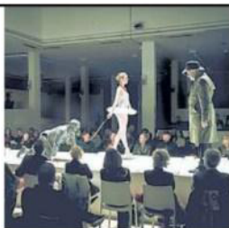
EX PALAZZINA GAM