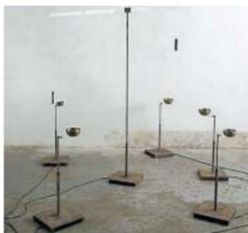
EX CHIESA DI SAN MATTIA