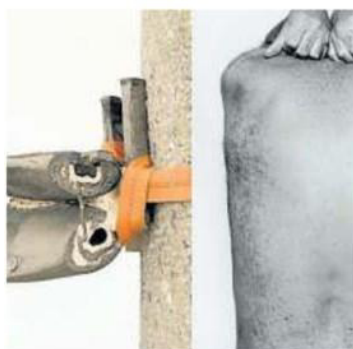
DISTRETTO MANIFATTURA ARTI

Nella palazzina di piastrelle colorate in via Corticella 56 debutta "Italia 170", anteprima del nuovo progetto di Flavio Favelli, curato da Elisa Del Prete e Silvia Litardi. Oggi 18-24, domani 11-24.