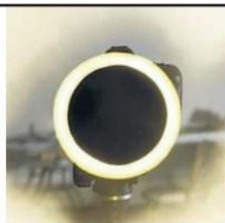
PALAZZO DE TOSCHI

Il luogo più vivace del dopo fiera, mai uguale a se stesso: mostre (Chironi/Moscardini, Keith Haring), performance, movida e sabato alle 21 anche Ugo Cornia che legge "Fiabe per badanti e vecchi disgraziati".