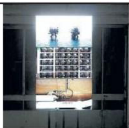
PALAZZO RE ENZO

Fila fuori dal Mambo e ingressi a ruba per la performance di Vadim Zakharov ispirata alla Rivoluzione russa, progetto speciale di Art City. La storia balla e canta su una lunga tavola oggi e domani alle 19, domenica alle 17.